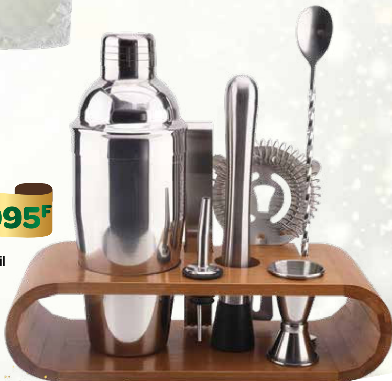
Coffret à cocktail 31049240