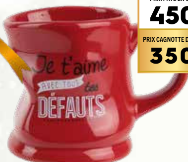
Mug déformé 20 cl 31049234

100F SUR MA CAGNOTTE* PRIX PAYÉ EN CAISSE 450F PRIX CAGNOTTE DÉDUITE 350F