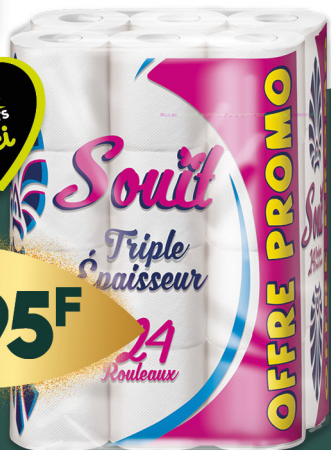
Papier hygiénique x24 SOUIT