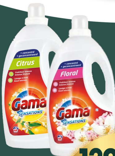
Lessive liquide citron ou floral GAMA 2.2 l - le litre : 589 F