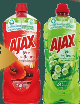
Nettoyant ménager Fête des fleurs, muguet, cerisier ou pure AJAX 1.25 l - le litre : 344 F