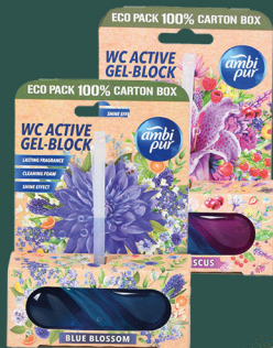
Bloc WC trigel différentes senteurs AMBI PUR 45 g - le kilo : 5500 F pour 2 achetés Panachage possible