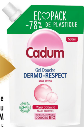
Gel douche recharge hydratant, dermato ou surgras CADUM 500 ml - le litre : 1190 F