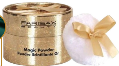
Magic Power poudre pailletée PARISAX

100 F SUR MA CAGNOTTE ® PRIX PAYÉ EN CAISSE 995 F PRIX CAGNOTTE DÉDUITE 895 F