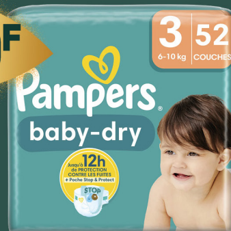
Couches Baby Dry différentes tailles PAMPERS