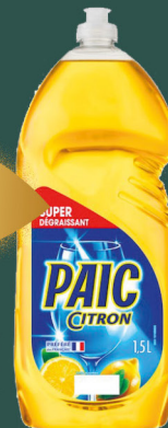
Liquide vaisselle citron PAIC 1.5 l - le litre : 663 F