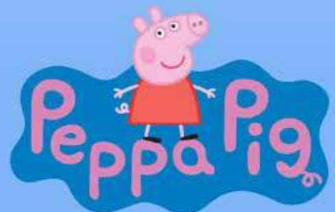
Table en plastique 50x55x44 cm Peppa Pig 72007953