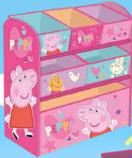
Tableau chevalet en bois avec espace de rangement Peppa Pig 72007757