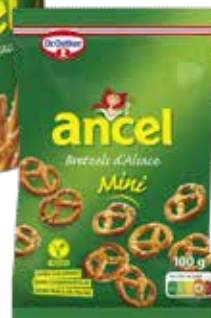
Mini bretzle ou stick & bretzel dès 100g DR OETKER

*Remise créditée sur la cagnotte, réservée aux membres Mon Club, non cumulable avec d'autres promotions en cours, non échangeable et non remboursable.