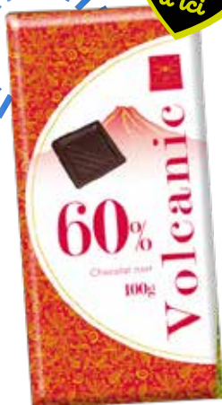
Tablette de chocolat volcanique 60% 100g CHOC&CO