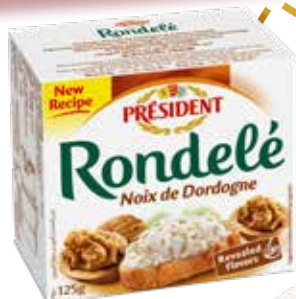
Rondelé aux noix de Dordogne 125g PRÉSIDENT