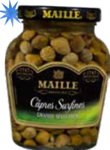
Câpre surfine 85g MAILLE