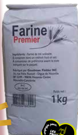
Farine ordinaire 1kg PREMIER

SUR CETTE SÉLECTION FESTIVE ! ET SUR PLUS DE 1000 PRODUITS EN MAGASINS !