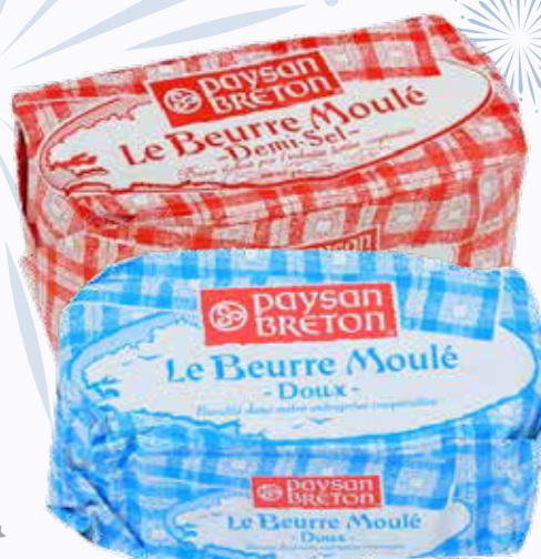
Beurre moulé doux, demi-sel, sel de Guérande ou -25 % sel PAYSAN BRETON 250 g - le kilo : dès 1 560 F