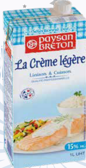
550 F Crème cuisson 15 % PAYSAN BRETON 1 L - le litre : 550 F