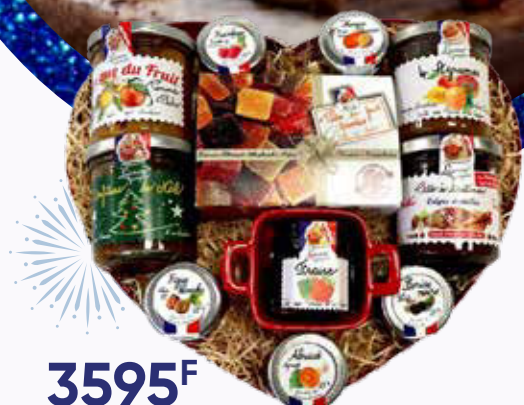
3595 F Corbeille Cœur LUCIEN GEORGIN 150 g - le kilo : 23 967 F