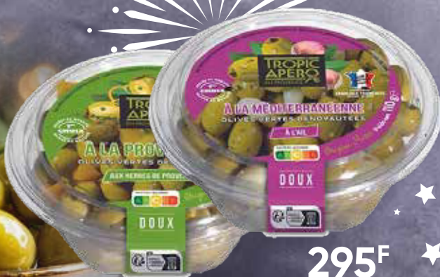
295 F Olives vertes dénoyautées Méditerranéennes ou Provençales TROPIC APÉRO 110 g - le kilo : 2 682 F