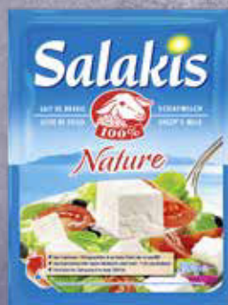
595 F Feta nature SALAKIS 695 g - le kilo : 2 975 F