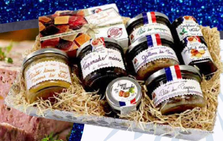
2995 F Corbeille Flora LUCIEN GEORGIN 140 g - le kilo : 21 393 F