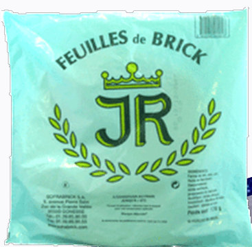
195 F Feuille de brick 10 feuilles JR 170 g - le kilo : 1 147 F