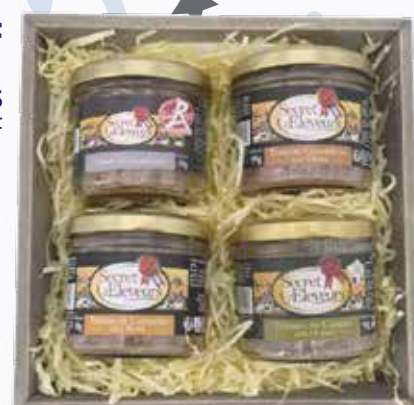
1795 F Corbeille Entre Amis 360 g - le kilo : 4 986 F