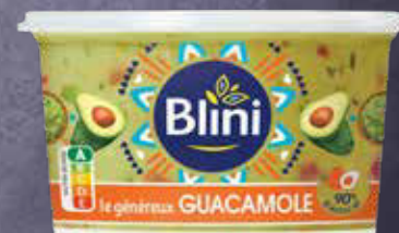
950 F Guacamole BLINI 200 g - le kilo : 4 750 F