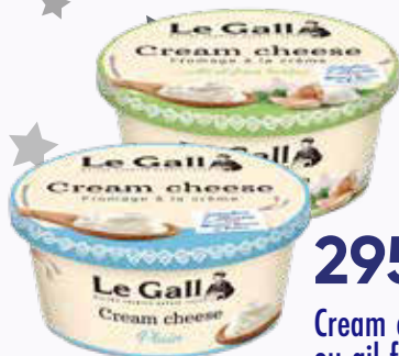
295 F Cream cheese nature ou ail fines herbes LE GALL 150 g - le kilo : 1 967 F