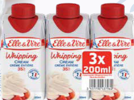
695 F Crème entière UHT 35 % ELLE&VIRE 3 x 200 ml - le litre : 1 158 F