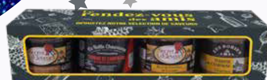
1750 F Corbeille Rendez-vous des Amis 360 g - le kilo : 4 861 F