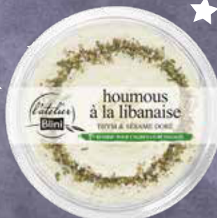
850 F Houmous à la libanaise L'ATELIER BLINI 175 g - le kilo : 4 857 F