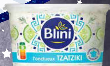
750 F Tzatziki BLINI 200 g - le kilo : 3 750 F