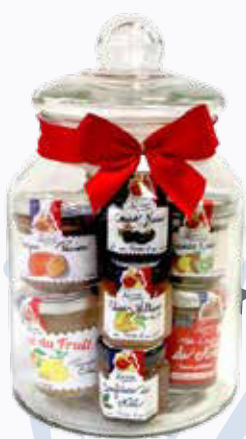
4295 F Corbeille Camille LUCIEN GEORGIN 400 g - le kilo : 10 738 F