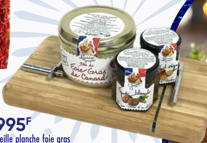
2995 F Corbeille planche foie gras LUCIEN GEORGIN 274 g - le kilo : 10 931 F