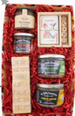
2495 F Corbeille Jeux en famille 100 g - le kilo : 24 950 F