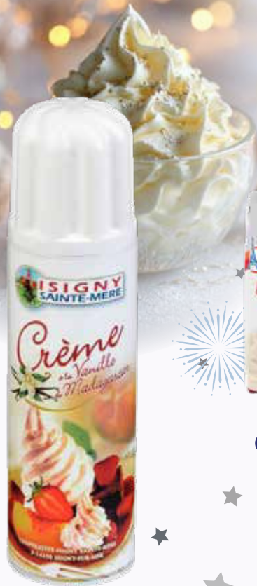
525 F Crème chantilly vanillée ISIGNY 250 g - le kilo : 2 100 F