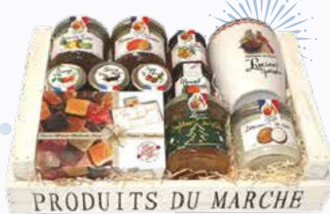
4295 F Corbeille Quentin 1 kg - le kilo : 4 295 F