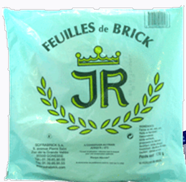
195 F Feuille de brick 10 feuilles JR 170 g - le kilo : 1 147 F