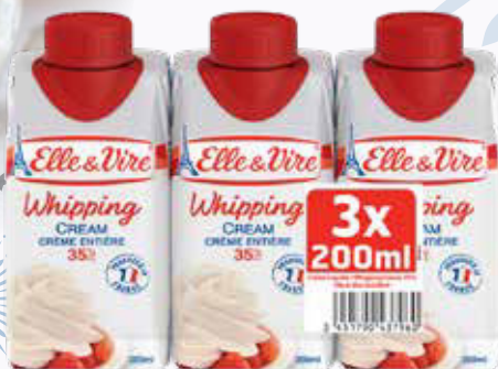
695 F Crème entière UHT 35 % ELLE&VIRE 3 x 200 ml - le litre : 1 158 F