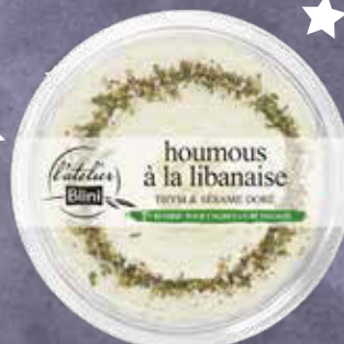
850 F Houmous à la libanaise L'ATELIER BLINI 175 g - le kilo : 4 857 F