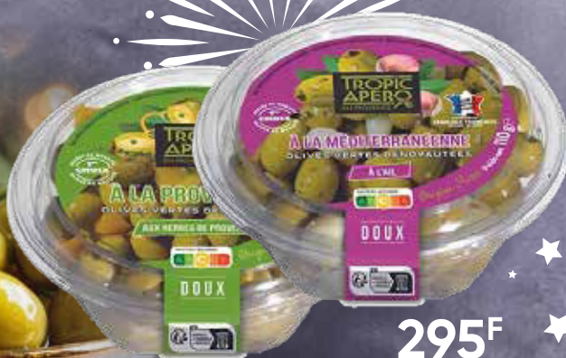
295 F Olives vertes dénoyautées Méditerranéennes ou Provençales TROPIC APÉRO 110 g - le kilo : 2 682 F