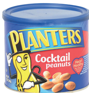
Cocktail peanuts 340 g PLANTERS