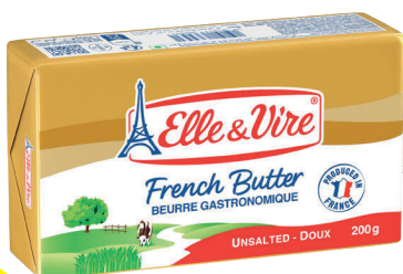
Beurre doux plaquette 200 g ELLE & VIRE