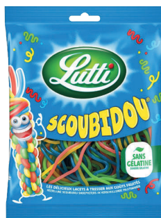
Bonbons Scoubidou 100 g LUTTI

*Remise créditée sur la cagnotte, réservée aux membres Mon Club, non cumulable avec d'autres promotions en cours, non échangeable et non remboursable.