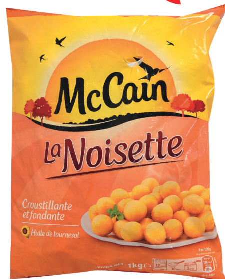
Pommes noisettes 1 kg MC CAIN