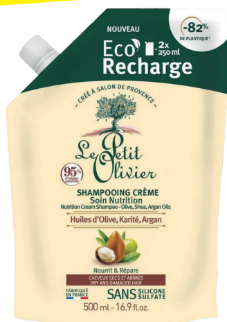
Shampooing oléagineux karité recharge 500 ml LE PETIT OLIVIER