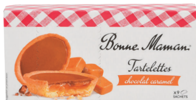
Tartelettes chocolat caramel 135 g BONNE MAMAN