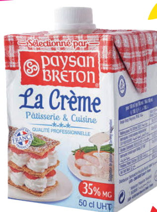
Crème UHT 35 % 500 ml PAYSAN BRETON

ET SUR PLUS DE 1000 PRODUITS EN MAGASINS !